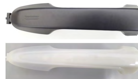
圖 2. 產品示意圖

為改善市售電容式觸碰開關之把手，其感應金屬片結構複雜，需配合外殼造型設計與裁切，不易固定，製作複雜，生產良率低。本研提計畫以射頻信號偵測人手，當人手靠近至 1 cm 距離時，可以非接觸方式開關車門，不需結構複雜的感應金屬片，亦不需配合外殼造型設計與裁切，可大幅提高生產線良率。